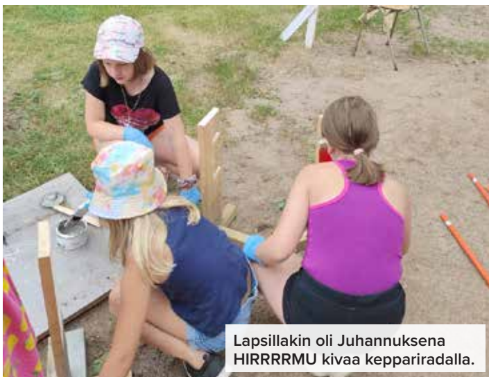
Lapsillakin oli Juhannuksena HIRRRRMU kivaa keppariradalla.