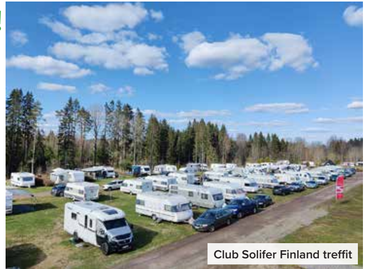
Club Solifer Finland treffit

Juhannusta vietettiin perinteisesti rauhakseen koko perheen juhannuksena ja palautteen perusteella lapsiperheet olivat viihtyneet hyvin Krapurannassa. Lasten oli helppo löytää samanikäistä seuraa ja juhannuspäivän perinteiseen leikkimiel-