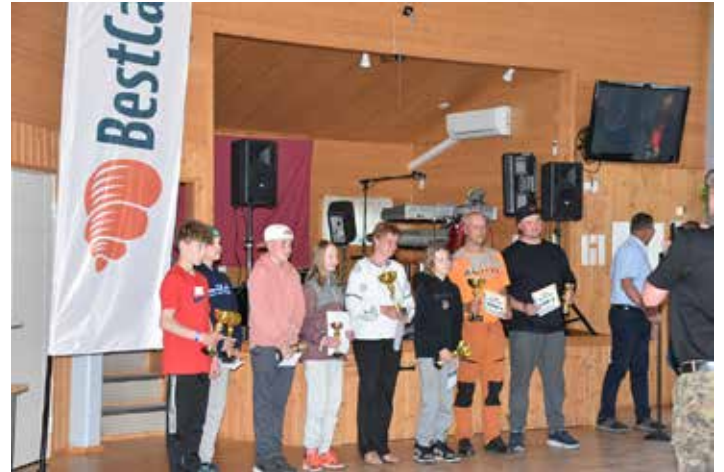
Karavaanareiden Frisbeen SM-kisojen parhaat