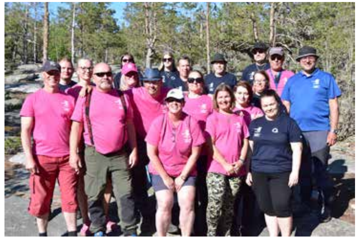
Frisbeegolf-kisojen toimihenkilöt yhteiskuvassa