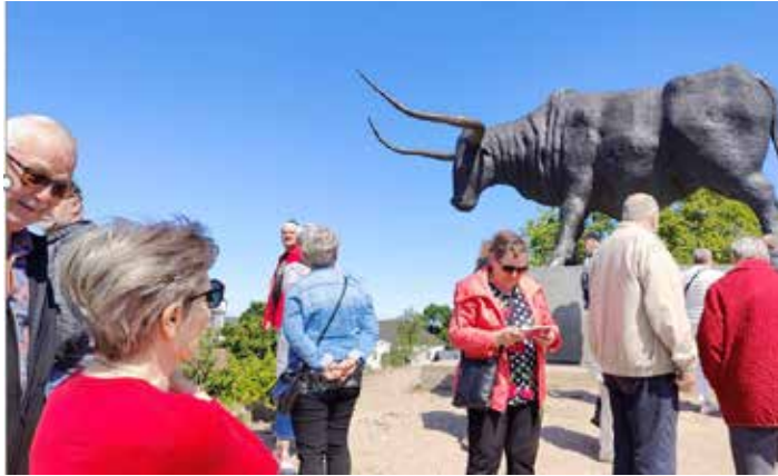
Tarvas – härkä