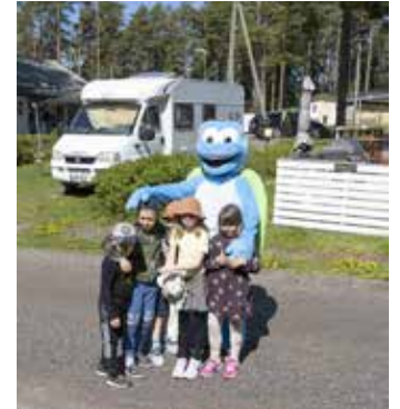
Aurinkotreffit Malti Matkaaja

vat meitä joten muistakaa pitää huolta itsestänne ja toisistanne. Ihanaa kesänjatkoa kaikille!