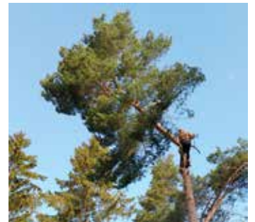
26.5 Vesa korkeuksissa.