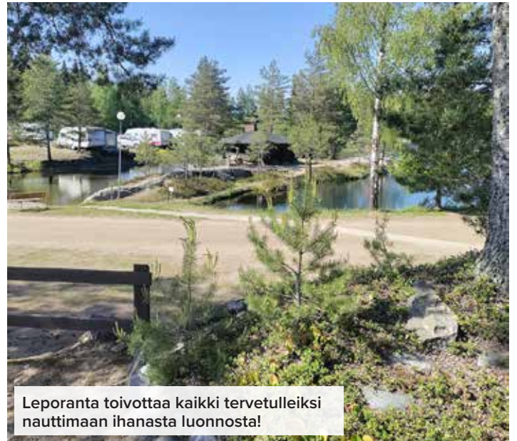
Leporanta toivottaa kaikki tervetulleiksi nauttimaan ihanasta luonnosta!