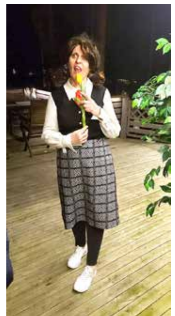
Naamiaistreffien parhaasta asusta palkittu