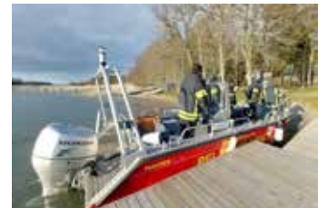
Paraisten vpk harjoitus navigointi 6.5 Stagsundiin.