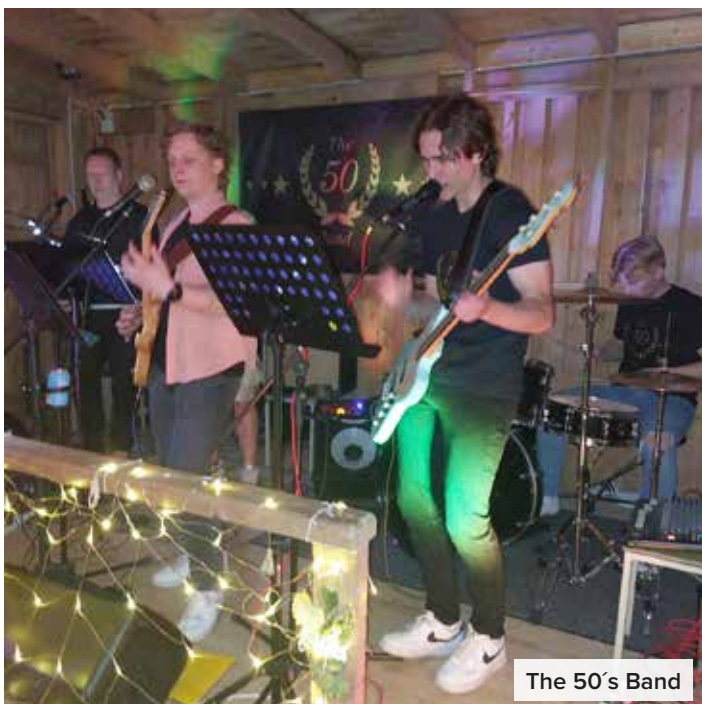
The 50's Band