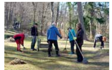
Haravointitalkoissa 22.4 oli 48 osallistujaa.