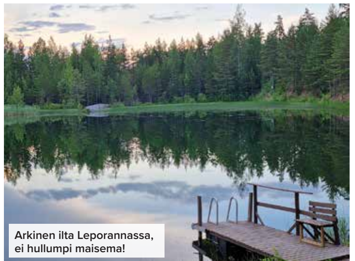
Arkinen ilta Leporannassa, ei hullumpi maisema!