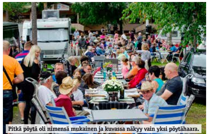
Pitkä pöytä oli nimensä mukainen ja kuvassa näkyy vain yksi pöytähaara.