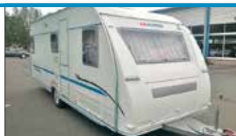
Adria Adora 552 PK 0 19.990 2011