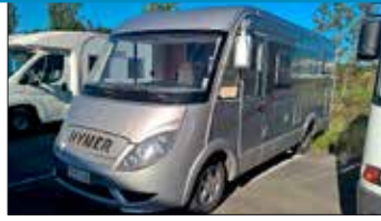
Ford-hymer Exsis 572 46.990 2009, 96 tkm. Erillisvuoteilla, p.tutka, erik.vant., met.väri, ilmast., h-kirja, lohkol., ym