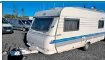
Hobby 495 ul Excellent-30D24L 0 7.990 2000