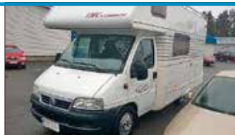
Fiat-Imc Liberty 590 2,3 22.990 2003, 147 tkm, p.tutka, h-kirja, lohkol., CD