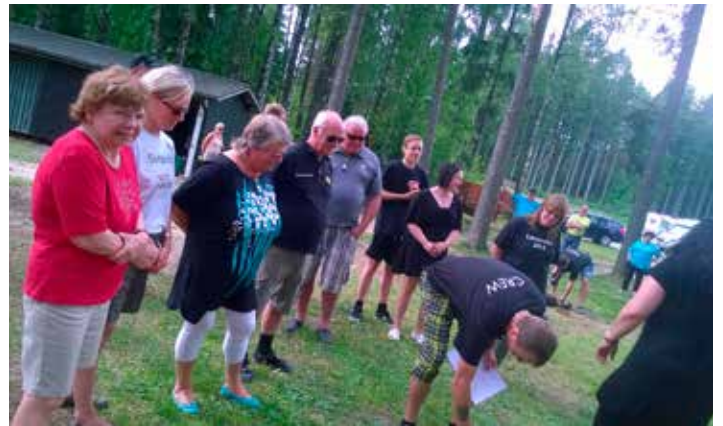
Kolmiotteluun osallistujia lavatreffeillä.