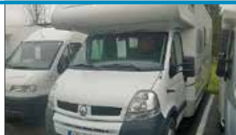
Renault Master Adria A697 SL 2,5 dCi 120 Autom. 34.990 2006, 93 tkm. Erillisvuoteilla, navi, ilmast., h-kirja, ym.