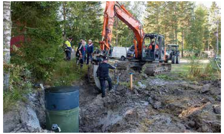
Linjapumppaamo on juuri nostettu kuoppaansa.

Mennyt kesä oli matkailun kannalta kaksijakoinen kylmän alkukesän ja paremman loppukesän takia. Matkailijat pääsivät vauhtiin vasta heinäkuun puolivälissä. Silloin olikin vilskettä. Yleensä trefeille on osallistunut väkeä entisaikoja vähemmän. Elokuun lopun