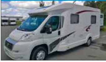
Eura mobil Profila pt 680 QB 64.990 2015, 1 tkm. Saarekevuode, luist.esto, ASR, kattol., ilmast., h-kirja, ym.