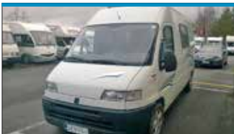
Fiat Pössl 2,8 JTD Ducato 13.990 2001, 149 tkm. Retkeilyauto, erik.vant., lohkol., CD, 2xrenk., vetok.