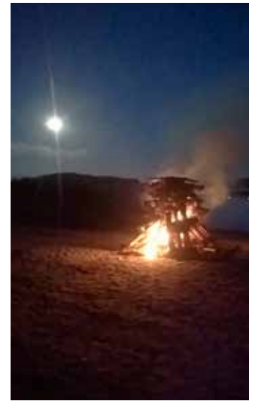
Muinaistulet: kuutamo, kokko ja kaarnaveneet.