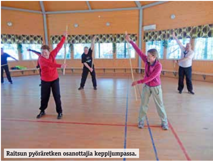
Raitsun pyöräretken osanottajia keppijumpassa.