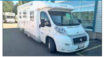
Elnagh Prince 520 I 3,0 Multijet 36.990 2009, 39 tkm, 160 hv, p.tutka, luist.esto, webasto, ilmast., h-kirja, CD