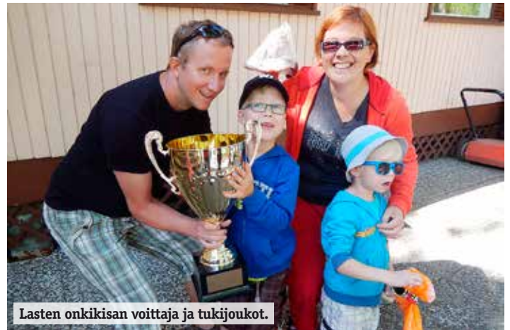
Lasten onkikisan voittaja ja tukijoukot.