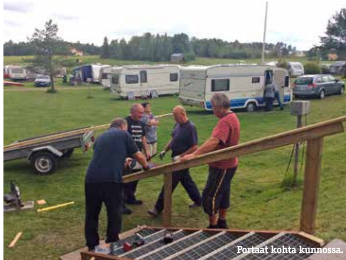
Portaat kohta kunnossa.