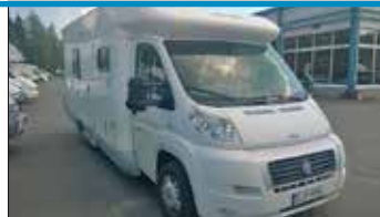
Fiat-Elnagh Duke 450L 35.990 2009, 50 tkm, kattol., ilmast., h-kirja, lohkol., CD, 2xrenk.