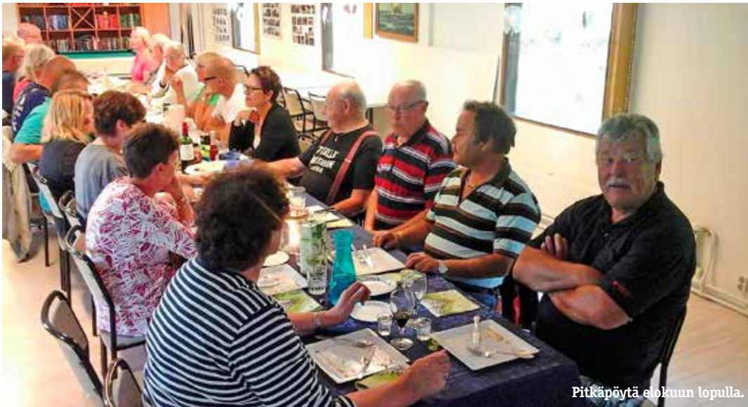
Pitkääpöytä elokuun lopulla.

nistön kädessä tai oikeastaan kynässä kun äänestetään.