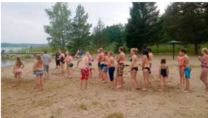
Lasten rantakisat lavatreffeillä.