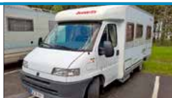
Fiat-dethleffs Ducato 2,8 JTD Globetrotter T5801 21.990 2002, 110 tkm kattol., h-kirja, lohkol., CD, 2xrenk., vetok.