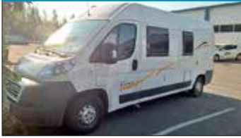
Adria Sun living Flexo V1 2,3 38.990 2010, 60 tkm, ESP, p.tutka, luist.esto, kattol., ilmast., lohkol., CD, 2xrenk.