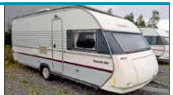
Solifer 560 TBR Finlandia Dometic AC 0 16.990 2008