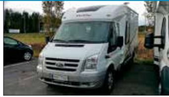
Hobby T 500 fsc 2,2 Tdci 37.990 2011, 90 tkm