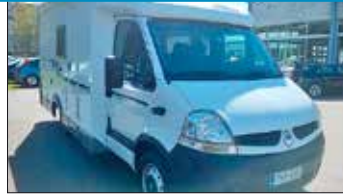
Renault Weinsberg Scout 632 38.990 2008, 37 tkm, p.tutka, kattol., ilmast., h-kirja