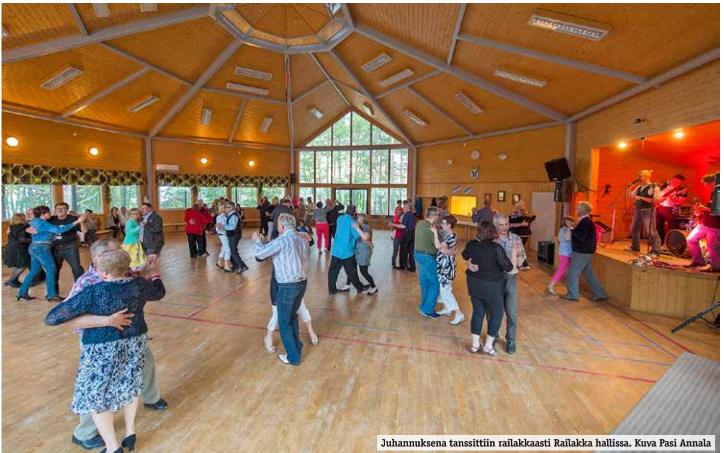
Juhannuksena tanssittiin railakkaasti Railakka hallissa.