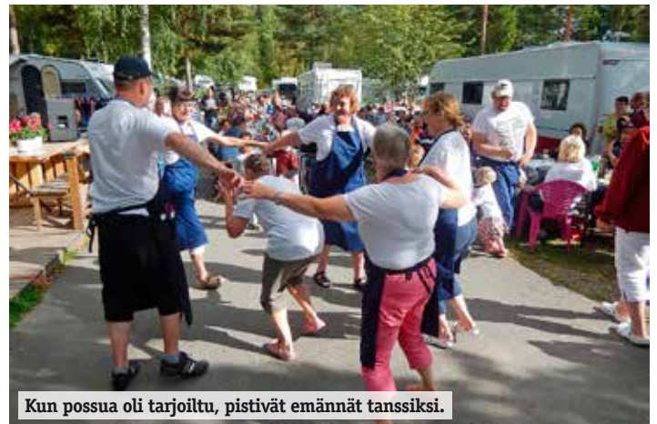
Kun possua oli tarjoiltu, pistivät emännät tanssiksi.