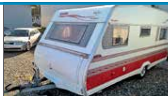
Kabe Brillant XL-KS-95/403 0 12.990 2003