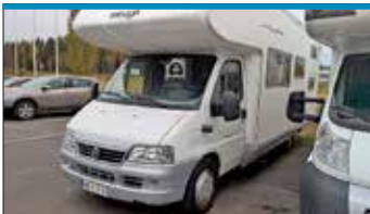
Fiat-Elnagh Super D 115 26.990 2006, 103 tkm