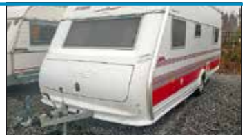
Kabe Smaragd GLE KS 0 22.990 2008, erillisvuoteilla, ALDE-nestekeskuslämmitys sähköllä ja kaasulla, ym.