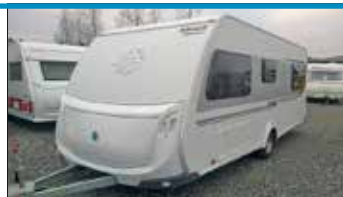
Knaus S dwind 590 FUS 0 24.990 2013, Scandinavian Edition