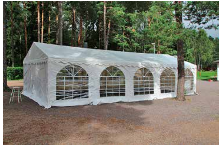
Yhdistykselle hankittu tällainen teltta.

Yhdistys oli syyskuussa järjestämässä kylpylämatkaa Sipoon kyl-