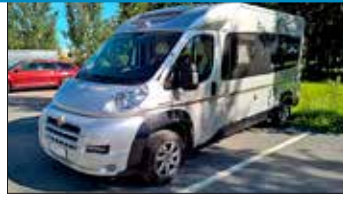
Burstner Fiat Brevio Perform T605 56.990 2014, 15 tkm