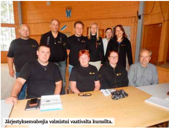
Järjestyksenvalvoja valmistui vaativalta kurssilta.