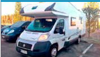
Mclouis Glamys 22 2,3JTD 36.990 2011, 91 tkm