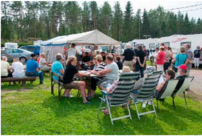
Yhteislaulut Pelimannipenkillä ovat myös tärkeä osa Haitaritreffejä.

kalla enemmän kuin edellisinä vuosina, joten lähes täysi höyry oli päällä jo torstaina. Myöskin säänt suosivat Haitaritreffejä.