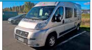
Fiat-Adria Twin 3,0 Multijet 29.990 160 hv, 2007, 126 tkm, ESP, luist.esto, navi, webasto, erik.vant., kattol., ym.