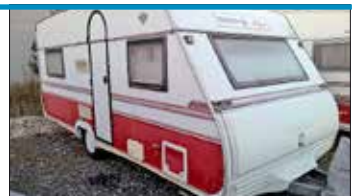
Kabe Brillant GLE 0 7.990 1997