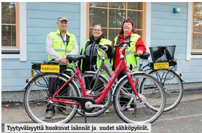
Tyytyväisyyttä huokuvat isännät ja uudet sähköpyörät.