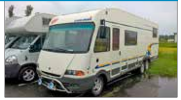
Fiat Ducato Eura mobil I 810 39.990 2,8 JTD KA 2003, 52 tkm, p.tutka, kattol., ilmast., h-kirja, CD