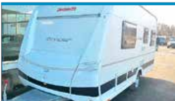
Dethleffs Camper 450 FL 0 21.990 2013, 1-om., kattol.