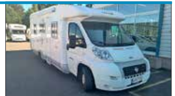
Elnagh Prince 520 I 3,0 Multijet 160 hv 36.990 -09, 39 tkm