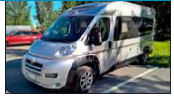
Burstner Fiat Brevio Perform T605 56.990 -14, 15 tkm