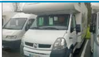
Renault Master Adria A 697 SL 2,5 dCi 120 Autom. 34.990 -06, 93 tkm. Erillisvuoteilla.