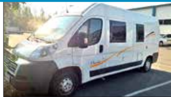
Adria Sun Living Flexo V1 2,3 38.990 -10, 60 tkm