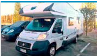
McLous Glamys 22 2,3JTD 36.990 -11, 91 tkm