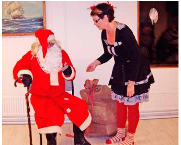
Joulupukkikin ehti mukaan.