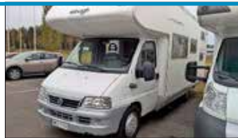
Fiat-Elnagh Super d 115 26.990 -06, 103 tkm