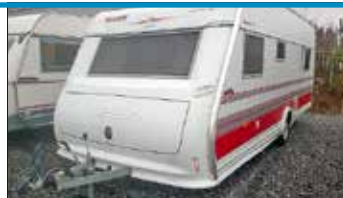
Kabe Smaragd GLE KS 0 22.990 -08. Erillisvuoteet.