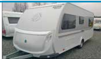
Knaus Sudwind 590 FUS 0 24.990 -13