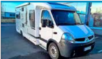
Renault-knaus Sun TI 650 MF 37.990 -09, 67 tkm