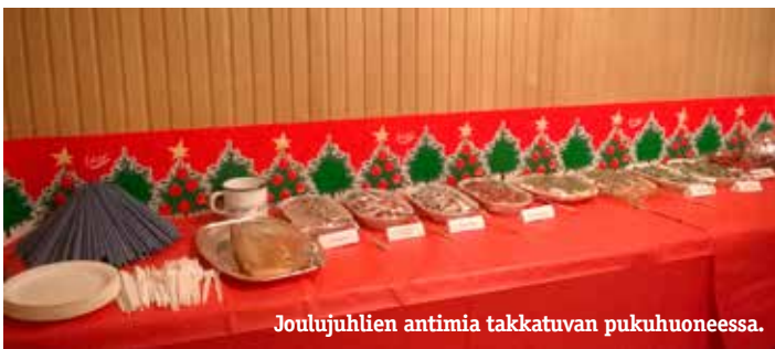
Joulujuhlien antimia takkatuvan pukuhuoneessa.