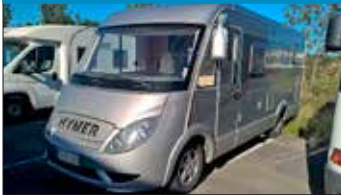
Ford-Hymer Exsis 572 46.990 -09, 96 tkm. Erillisvuoteilla.