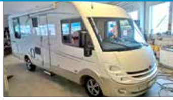
Fiat-Burstner Viseo I 726 59.990 -12, 36 tkm. Saarekevuode.