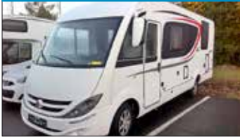
Burstner Viseo 720 74.990 Fiat 150 hv 2,3 JTD -15, 16 tkm. Prinsessavuode!