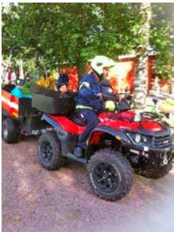
Mönkijän kyydissä (turvallisuustreffit).