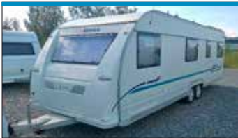
Adria Classica 743 UL 0 22.990 -11. Erillisvuoteet.