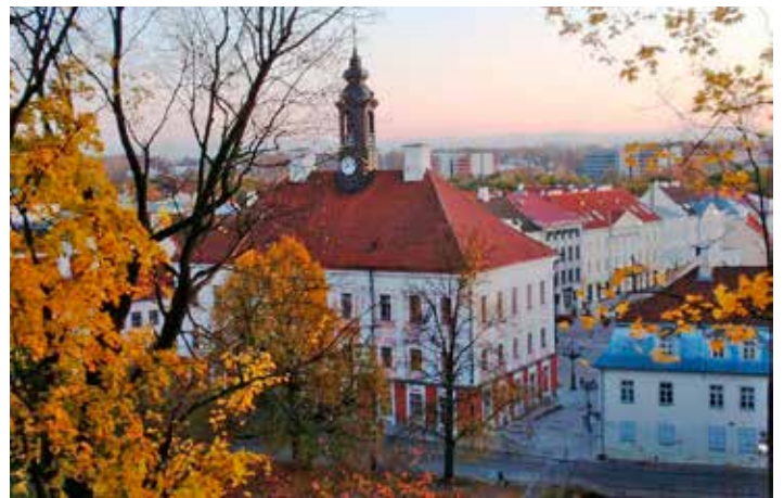
Tartton Kaupungintalo.

Seuraa tiedotteluamme Vankkuriviestistä ja Nettisivuiltamme www.sfc-salonseutu.fi