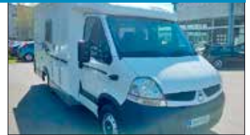
Renault Weinsberg Scout 632 38.990 -08, 37 tkm