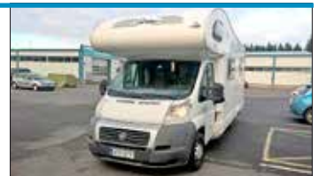
Miller Illinois Fiat 130 hv 2,3JTD 29.990 -07, 74 tkm