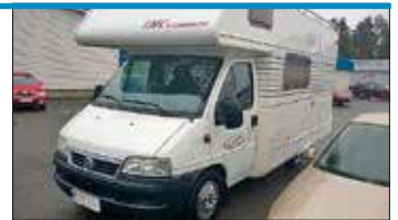
Fiat-LMC Liberty 590 2,3 22.990 -03, 147 tkm