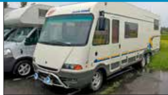
Fiat Ducato Eura Mobil I 810 2,8JTD KA 39.990 -03, 52 tkm