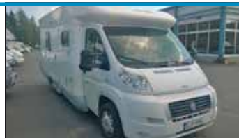
Fiat-Elnagh Duke 450L 35.990 -09, 50 tkm