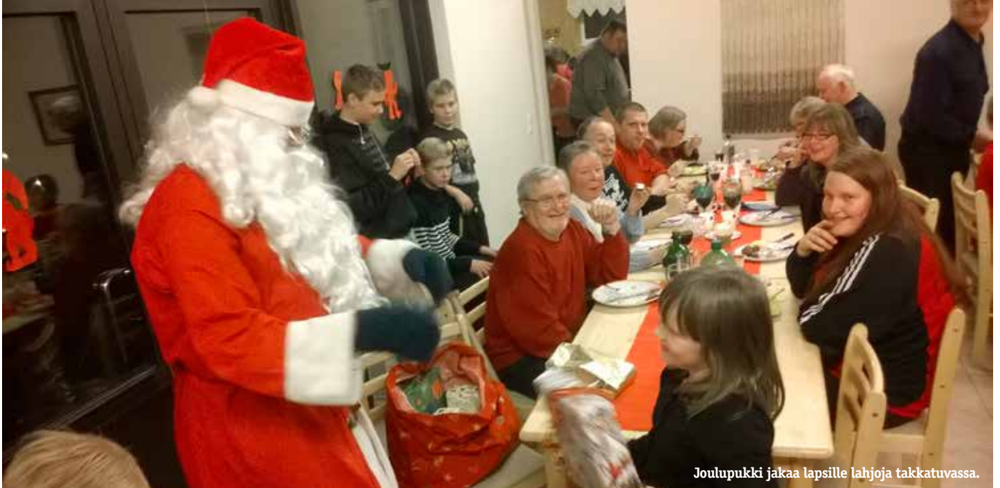
Joulupukki jakaa lapsille lahjoja takkatuvassa.