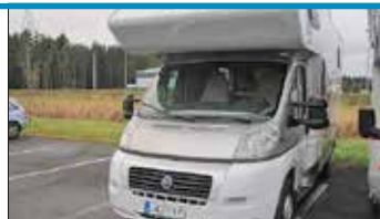
Fiat Hobby Toskana 615 37.990 -08, 63 tkm