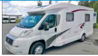
Eura Mobil Profila PT 680 QB 64.990 -15, 1 tkm. Saarekevuode.