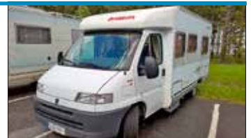
Fiat-Dethleffs Ducato 2,8 JTD Globetrotter T5801 21.990 -02, 110 tkm