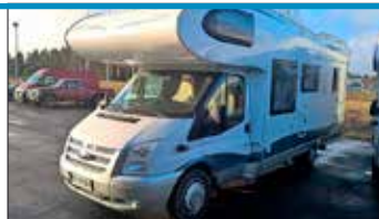
Ford-Hobby Siesta T 650 AK GFLC 37.990 -08, 21 tkm