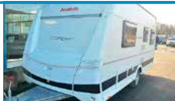
Dethleffs Camper 450 FL 0 21.990 -13