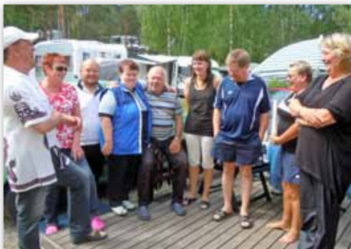
"Raitsun laihisryhmä" aloitti urakkansa juhannuksena.