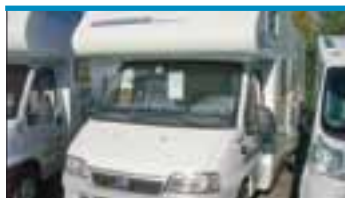
Fiat-Adria Ducato 2,8 JTD A 660 SP Matkailuauto 81 tkm, 2004 37.990