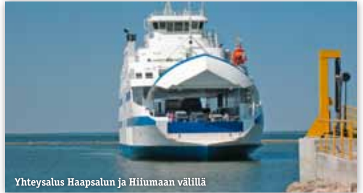
Yhteysalus Haapsalun ja Hiiumaan välillä

Illalla lähdimme kulkemaan rantapromenadille, jonka varrella oli paljon katseltavaa ja ihasteltavaa, kuten lahdella asustelelevan joutsenparin lumoa. Päädyimme syömään Grande Pizzaan, jossa pizzat olivatkin paikan nimen veroisia; suuria ja todella maukkaita. Osa porukasta oli jaksanut jälleen tanssia helteisestä säästä huolimatta. Loppuillalla istuimme kaikki yhdessä laulu-tuokion merkeissä.