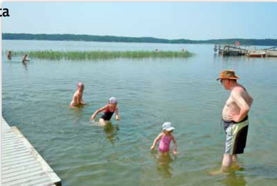
Yksi lapsien mieliharrastuksesta ovat vesileikit.