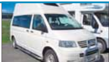
Volkswagen Transporter 2.5 TDI 96 kW Reimo CarsSport Retkeilyauto 121 tkm, 2008 36.990