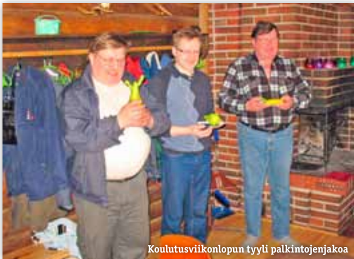
Koulutusviikonlopun tyyli palkintojenjakoa

Kiitos kaikille karavaanareille; kuljettajalle, matkakumppaneille ja ystäville!