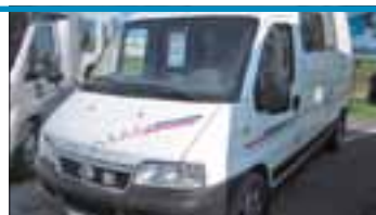
Fiat-Adria Win 2,3 JTD Retkeilyauto 137 tkm, 2003 24.990