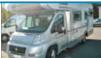
Fiat-Knaus Sport Traveller 700 dg Silver! 3.0 JTD, 160 hv 12 tkm, 2008 46.990