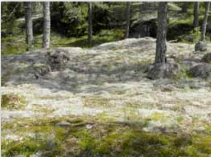
100m päässä lähimmästä vaunusta Salorannasta löytyy tällaista maisemaa.

Kari Rainetsalo kiittää saamastaan huomionosoituksesta merkkipäivänään