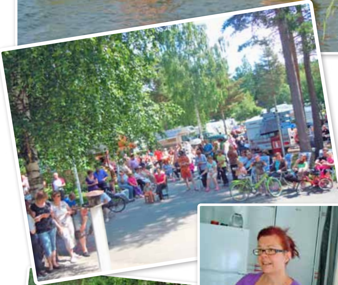
Juhannuksen viettoa suosi kaunis kesäsää.