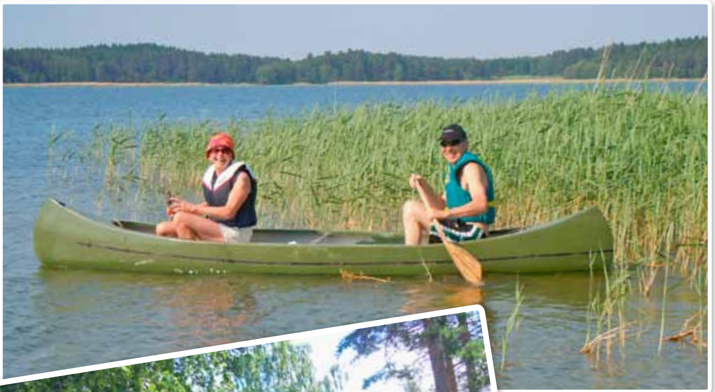
Kauniilla kesäsäällä voi piipahtaa vaikkapa kanootilla Uudessakaupungissa, kuten Rantoset