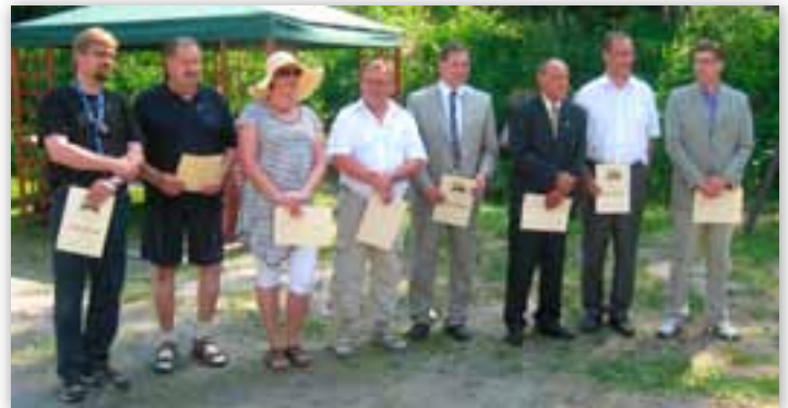
35 v. -juhlat, ansiomerkkien saajia