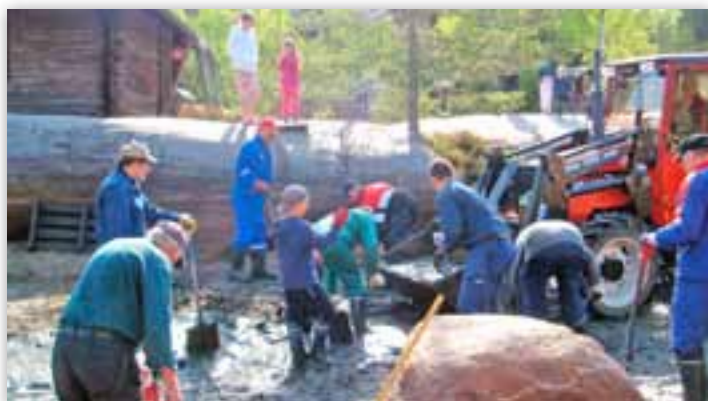
Talkoilla pikkulampi kuntoon ja konevoimaakin onneksi apuna.

Leporanta on edennyt kevättä ja kesää perinteisesti rauhallises-