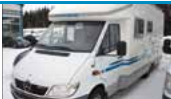
Adria Mb 316 Stargo 670 SP 14 tkm, 2005 56.990