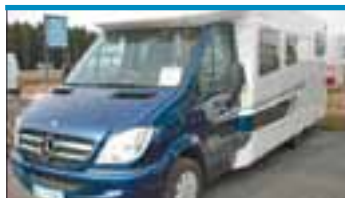
T.e.c Star ti 7205 MB 15 tkm, 2009 74.990