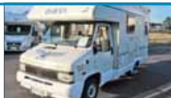
Riviera Fiat 200 1.9 TD 206 tkm, 1994 9.990