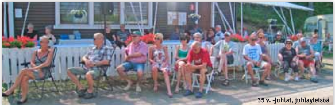
35 v. -juhlat, juhlayleisöä