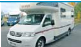
Volkswagen-Karmann Transporter Colorado 660 Solifer 2.5TDi, 10 tkm, 2006 49.990