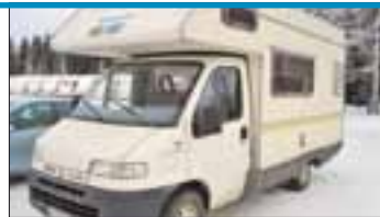
Fiat Granduca Auto-Roller 4 1.9TD, 151 tkm, 1999 17.990