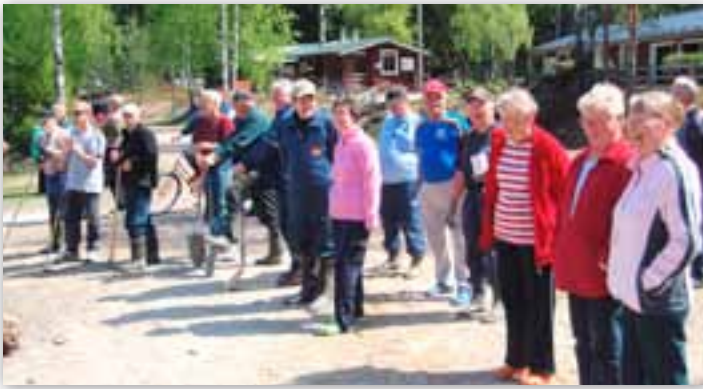
Talkootyön tuloksia on porukalla ilo katsella, pikkulampi putsattu.

ti vappua juhlien riemuriihessä, sekä keskikesän juhlaa juhannusta vietettiin myös laulun ja tanssin parissa noin 70 jäsenperheen kesken.