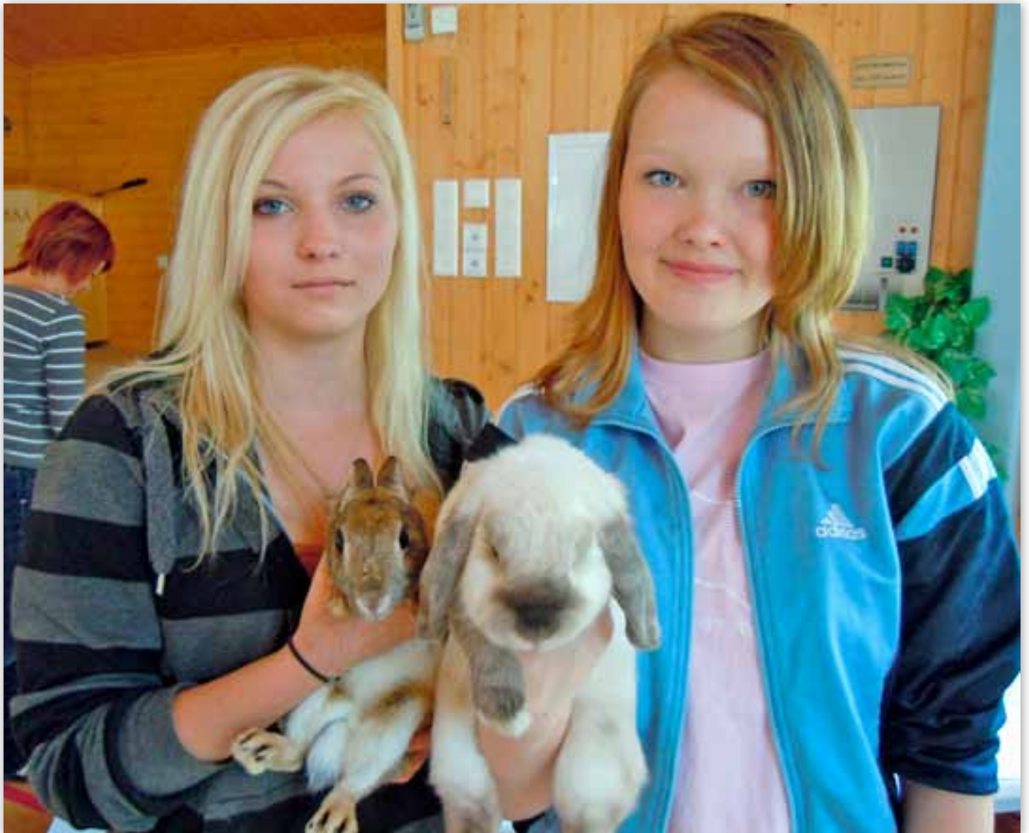
Rairannan lemmikkieläinpäivillä nähdään monia hellyttäviä lemmikkejä.

Nähdään taas Rairannassa! Kesäterkuin Rami