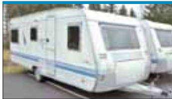
Adria C 563 UL 0 2001 11.990