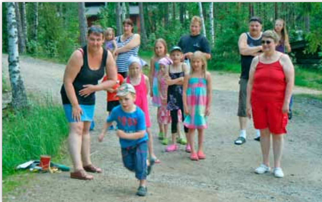
Lasten olympialaisissa on vauhtia.