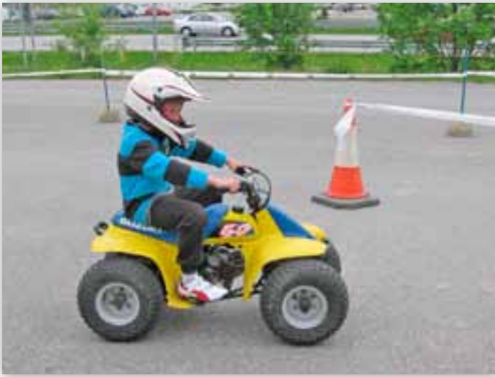
Mönkkärillä ei juurikaan taukoja tullut

käytetään luennoilla opiskelun ja keskustelun pohjana. Tavoite on saada nuoret itse havaitsemaan riskitoimintansa vaarallisuus, sekä tuntemaan vastuunsa