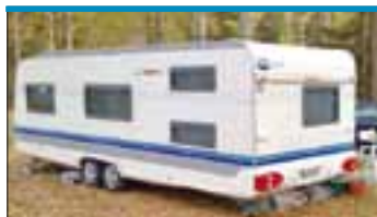
Hobby 650 KMFE Exclusive 0 2004 16.990