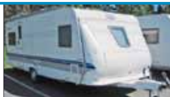
Hobby 560 UFE Excelsior 0 2006 17.990