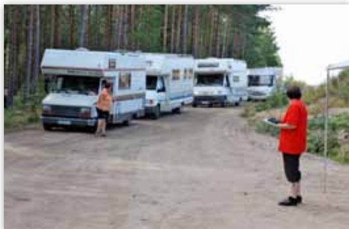
Vuonna 2010 Lavatreffeille tulijoita.

Alueella on paljon lapsia ja nuoria, jotka kilvan kirmaavat kaveridensa kanssa. Onneksi nämä tulevat karavaanarit nauttivat