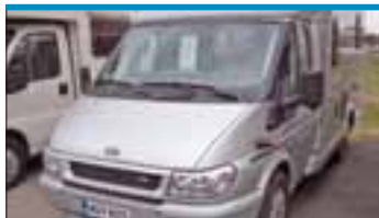
Ford-Hymer Van 522 34 tkm, 2006 36.990