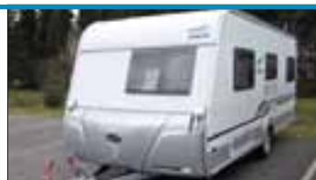
Wilks S4 490 HTD 0 2008 15.990