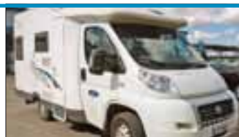
Fiat-mclois Ducato 252 Lagan 61 tkm, 2008 39.990