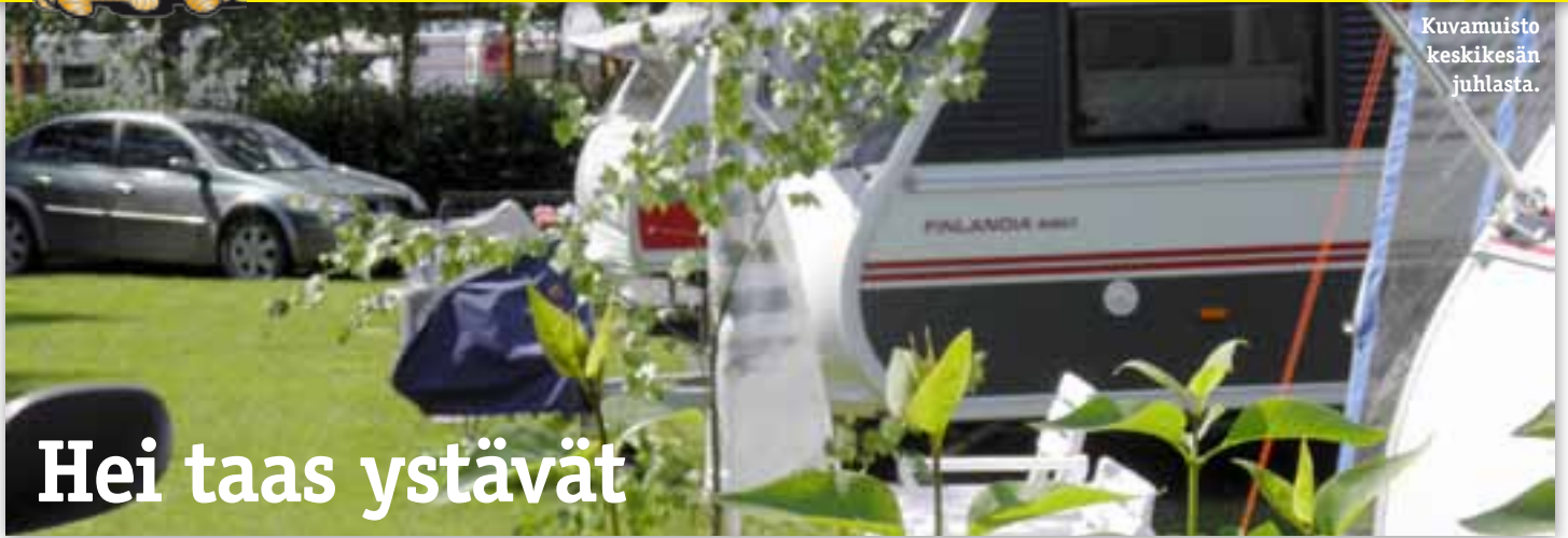
Kuvamuisto keskikesän juhlasta.