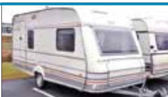
Lmc 450 K 0 1997 9.990