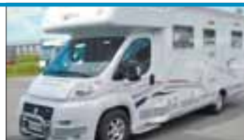
Frankia 680 rd 3.0TDI 19 tkm, 2008 59.990