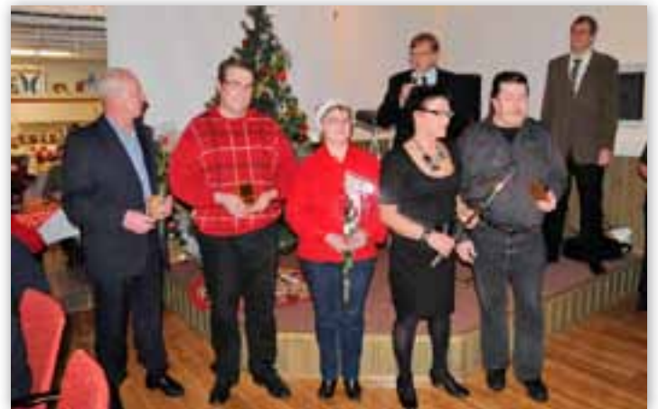
Laattojen saajat yhteiskuvassa

energiankulutuksen pienentyä huomattavasti, vaikka ilmastointi samalla paraneekin moninkertaiseksi. Kun tätä luette, on nais-