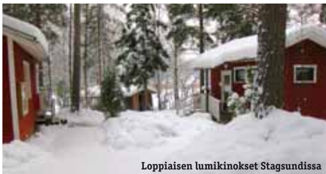
Loppiaisen lumikinokset Stagsundissa