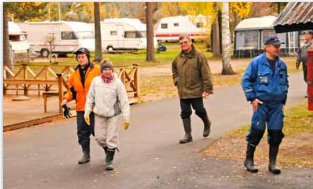
Muistoja syksyltä. Talkooväkeä saapuu ruokailuun.

Saunarakennuksen korjausta on tehty pakkasista huolimatta ja miesten puoli on jo remontoitukin. Kyllä kova käyttö jättää jälkensä. Kattopaneelit on uusittu, laatoituksia on korjattu, lauteet ovat saaneet uudet puuosat ja ilmastointi on yhdistetty uuteen koneeseen. Kun ilmaputkia lisättiin ullakolle, todettiin, että lämpöeristeet, vanhat puhallusvillat olivat häipynyt aikojen kuluessa. Kun uudet eristeet on laitettu katoille ja ilmastointi yhdistetty lämmön talteenottavaan koneeseen, pitäisi