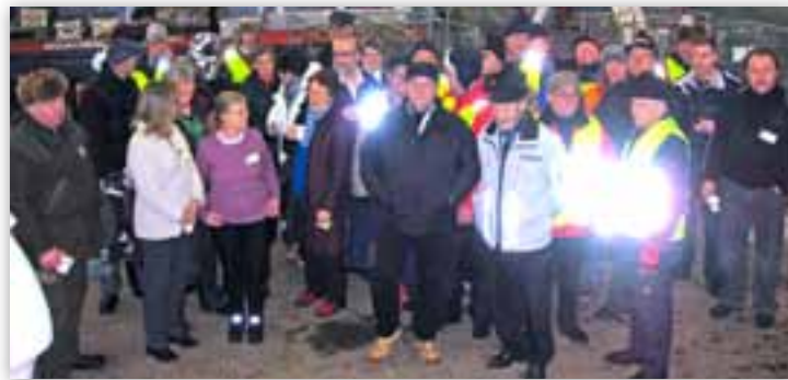
Pg. Sunnuntain kahvitilaisuuteen kokoontui lähes kaikki järjestelyissä mukana olleet toimihenkilöt.

Caravan Show & Camping uusi 3-vuotinen jatkosopimus jatkaa SF-Caravan ry:n ja Turun Messu- ja Congressikeskuksen sekä SF-Caravan Turku ry:n pitkää ja menestyksestä yhteistyötä vuoteen 2014. Caravan show & Camping järjestetään jatkossa myös tammikuussa tutulla paikalla.