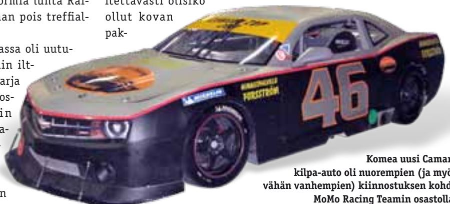
Komea uusi Camaro kilpa-auto oli nuorempien (ja myös vähän vanhempien) kiinnostuksen kohde MoMo Racing Teamin osastolla.

Treffijärjestelyiden onnistumisesta vastasi 57 karavaanaria tehden ympäröyviä