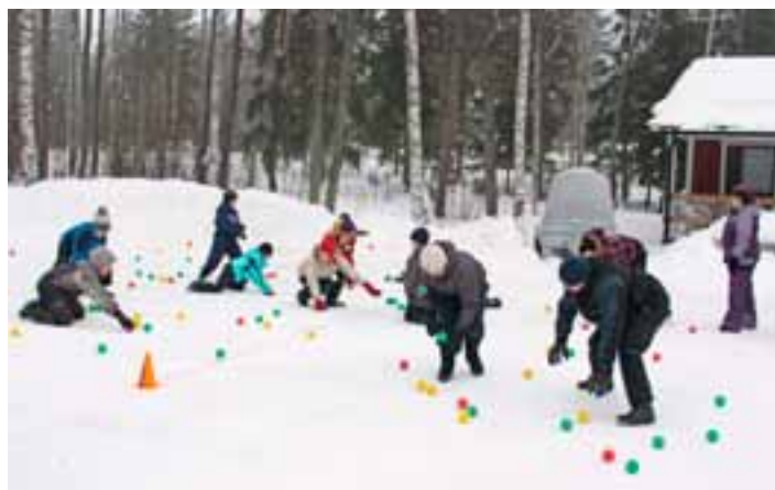
Talvellakin voidaan pelata.