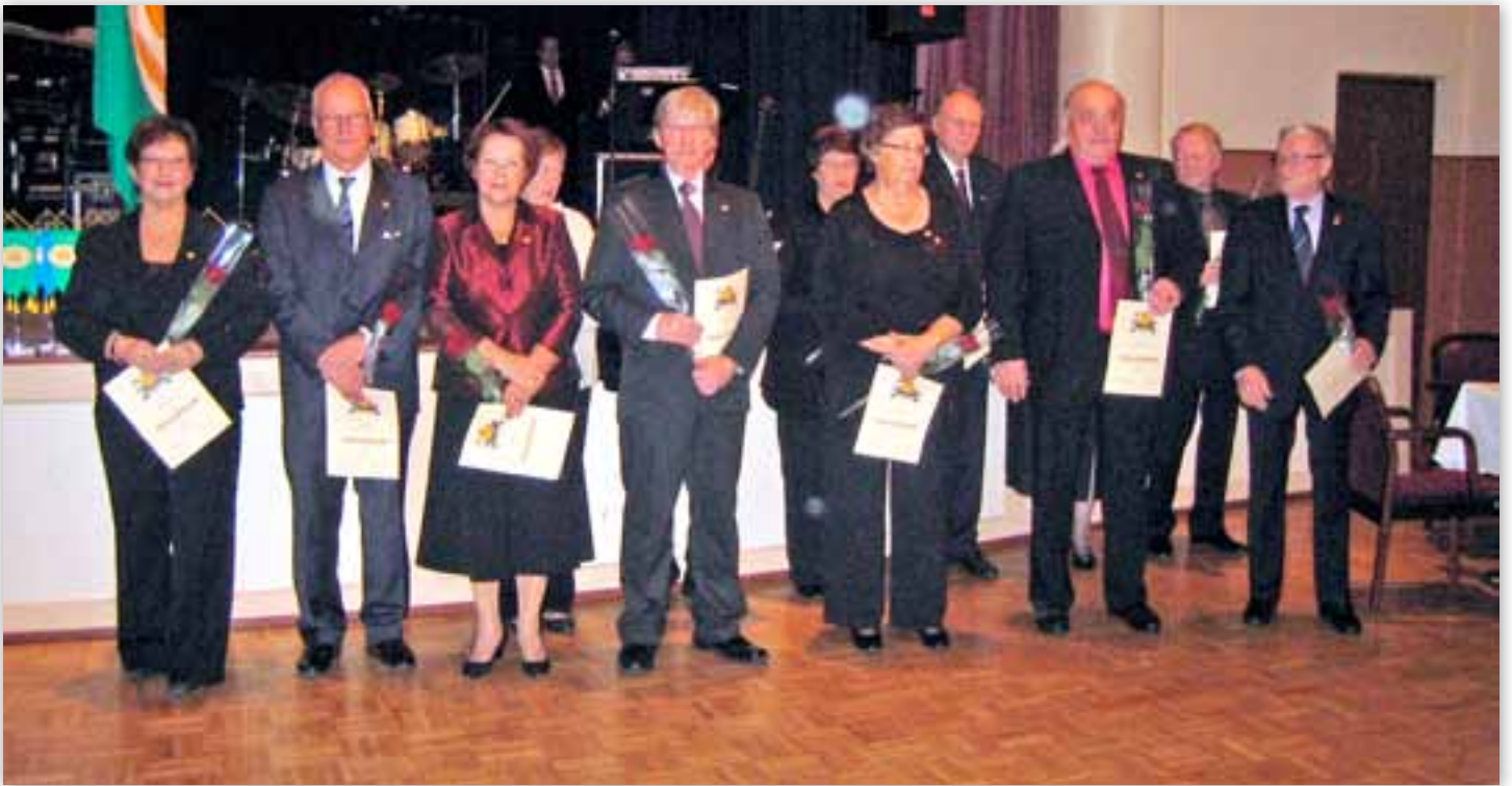
Hopea ja kultamerkkien saajat yhteiskuvassa Heimolinnassa 30-vuotisjuhlien yhteydessä.

teiksi asetettiin 150 jäsentä joka saavutettiin 1987. Oman leirintäalueen hankinta tuli ajankohtaiseksi 1990 jolloin hankittiin Krapuranta Oripäästä,