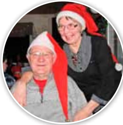
Sarkin pariskunta - Iloisin ilmein ja joulumielellä.

tirakenteen ansiosta lattia on kärsinyt kovien pakkasten aiheuttamasta elämisestä ja pintaan on syntynyt "railoja", joita ei voi paikata.