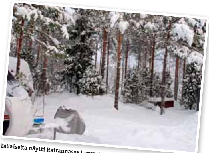
Tällaiselta näytti Rairannassa tammikuun 9. päivänä