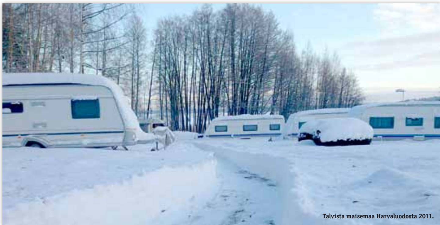
Talvista maisemaa Harvaluodosta 2011.